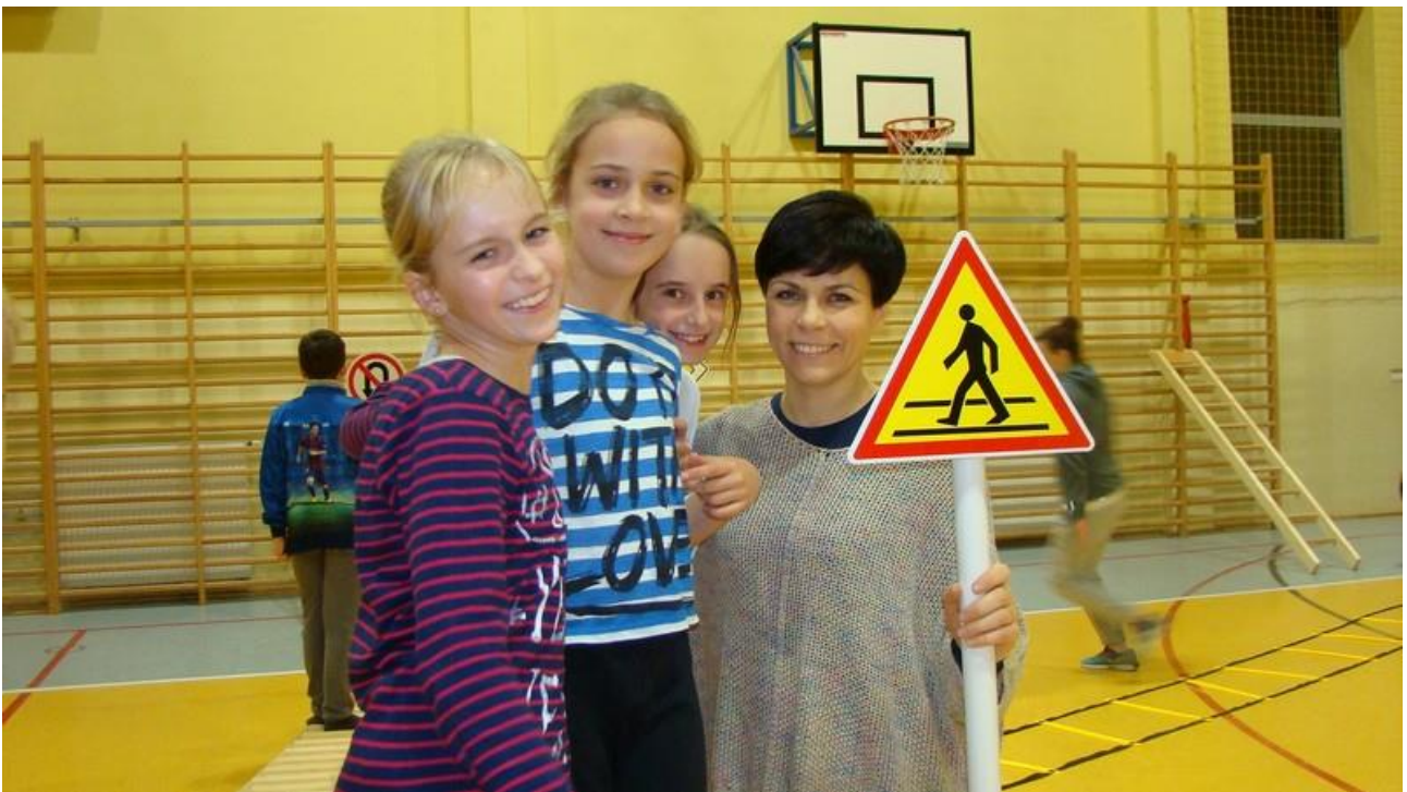
To przecież takie proste.