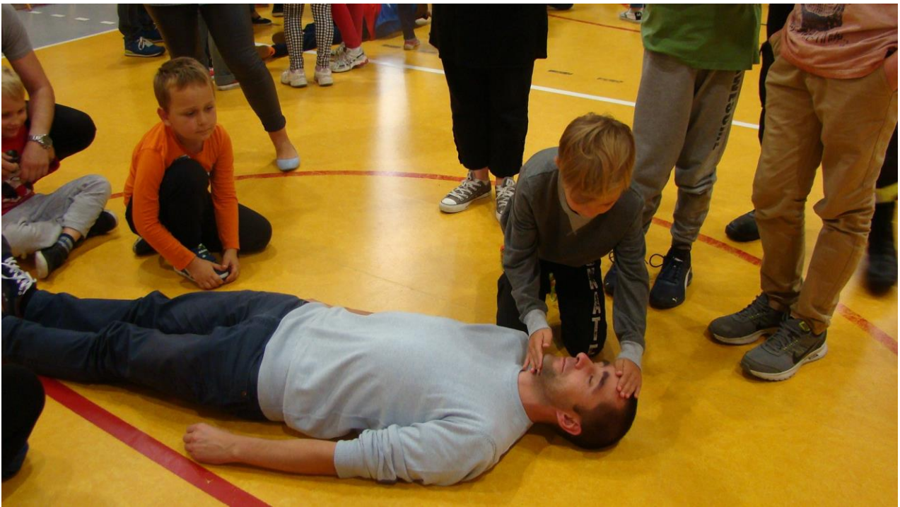
ćwiczenia w wykonaniu taty i syna