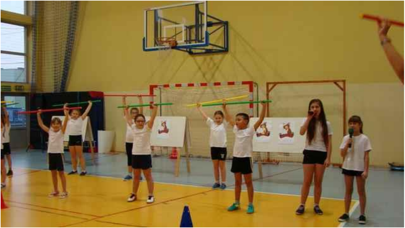
Wspólna piosenka i taniec były zaproszeniem do wspólnej zabawy.