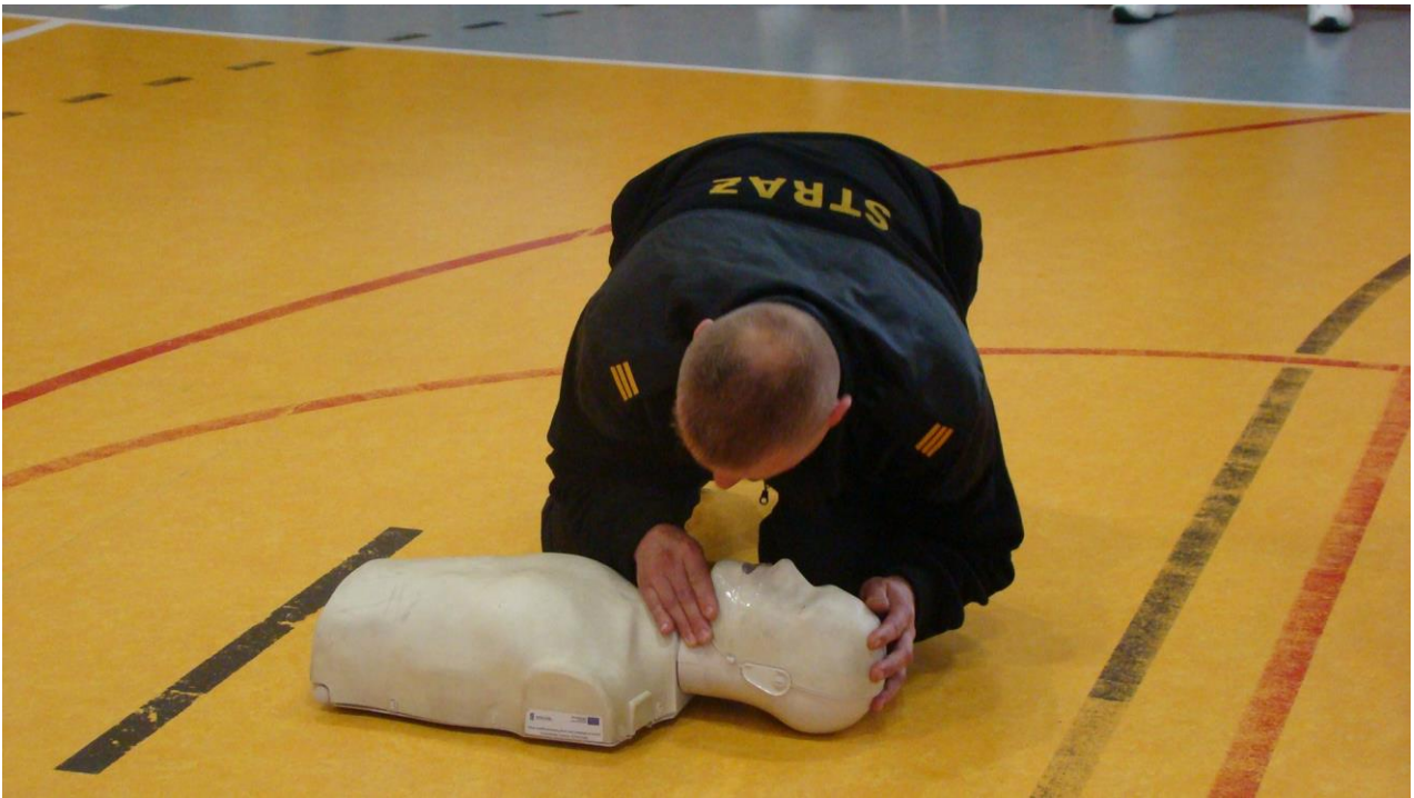
resuscytacja krążeniowo – oddechowa