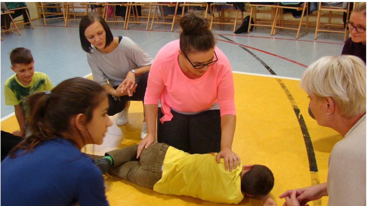
wykonie pozycji bocznej bezpiecznej , kiedy poszkodowany stracił przytomność , ale oddycha i ma zachowaną pracę serca