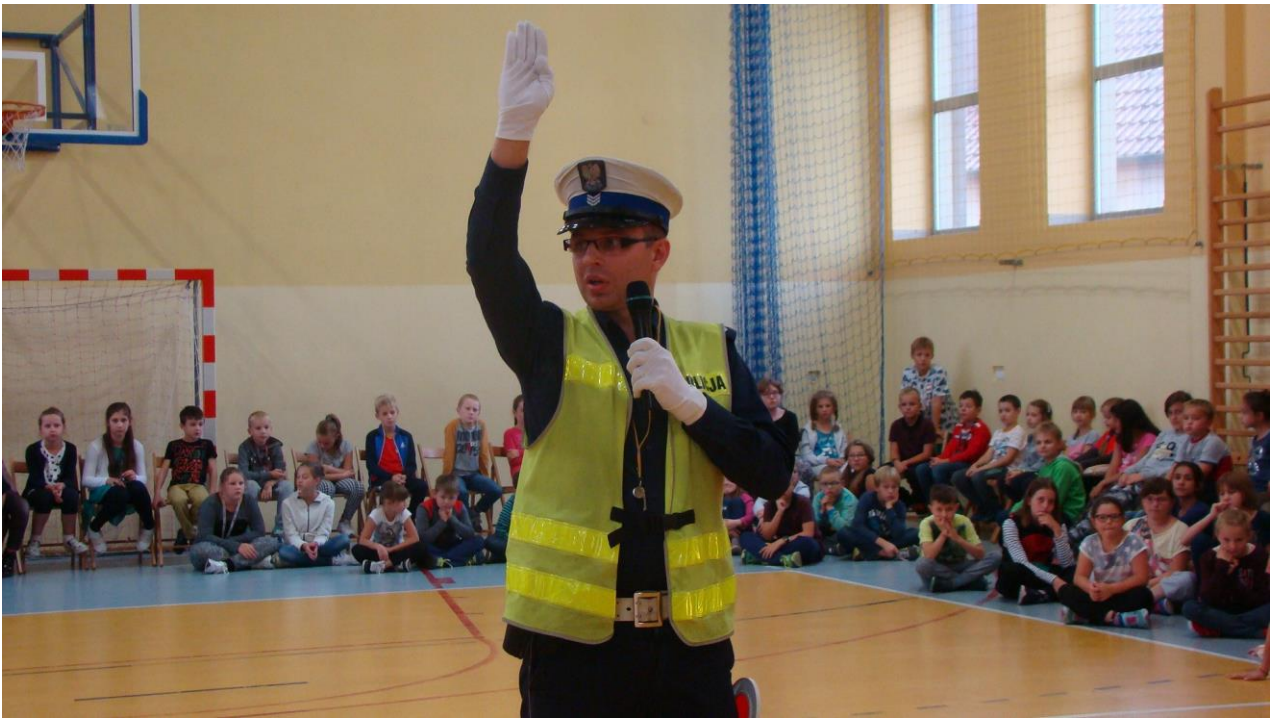
pokaz kierowania ruchem drogowym