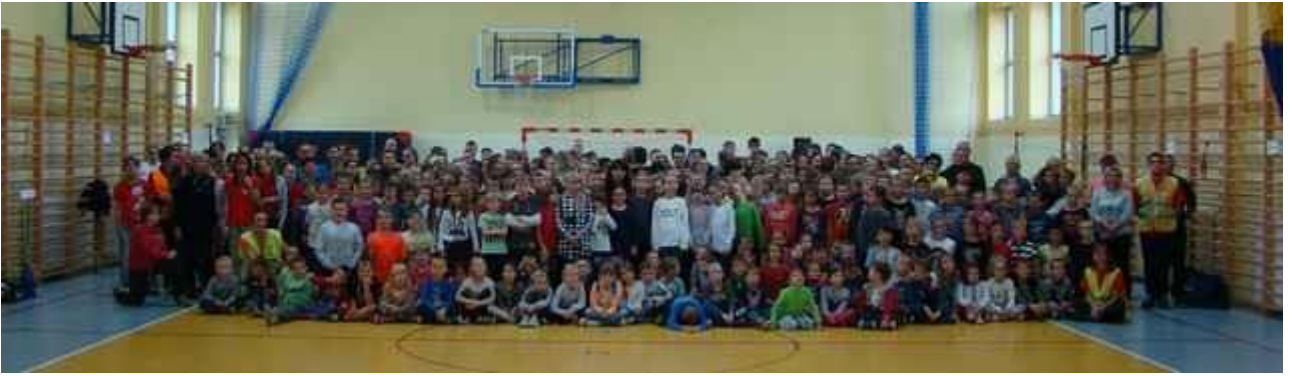
wspólne zdjęcie uczestników bicia rekordu