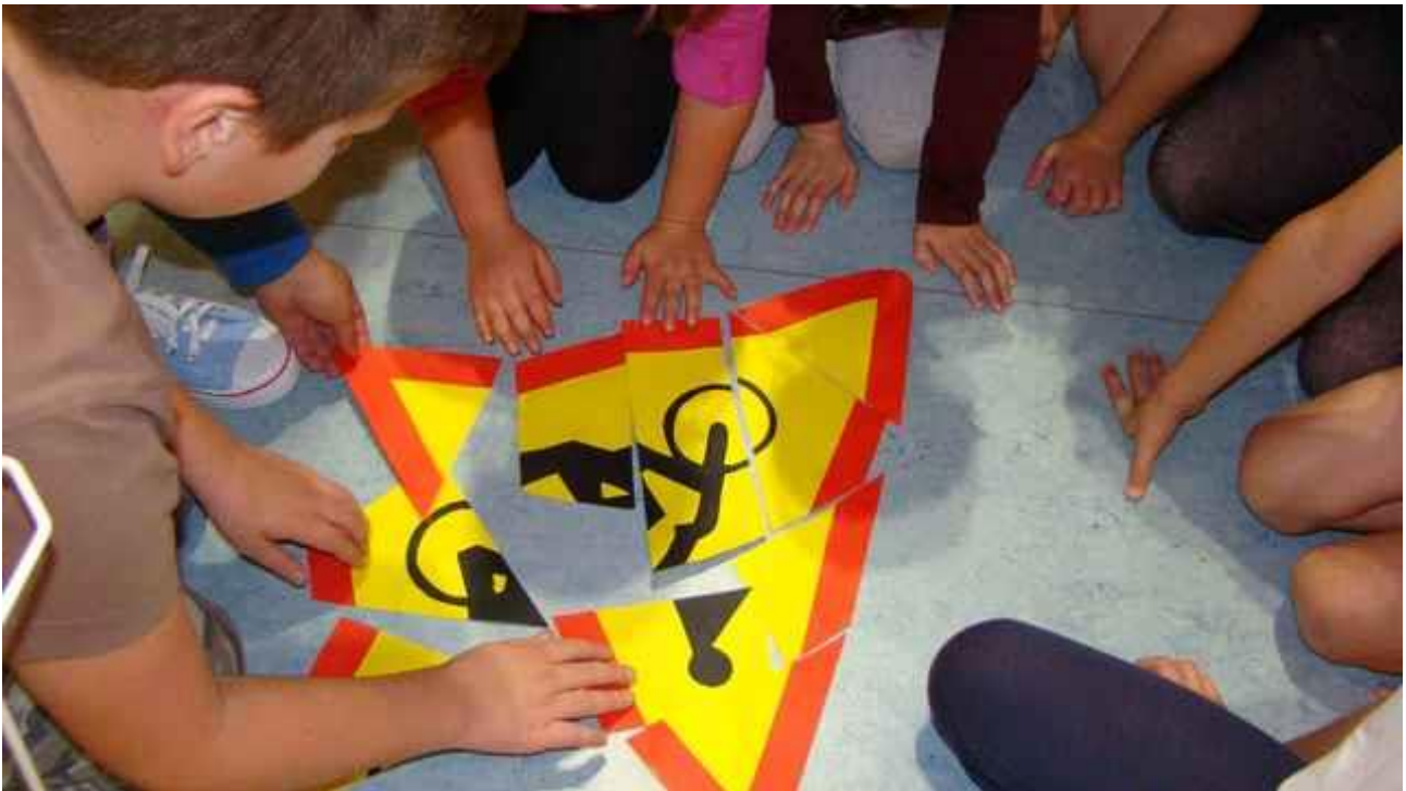
Poprzez wspólną zabawę uczymy się rozpoznawania znaków drogowych.