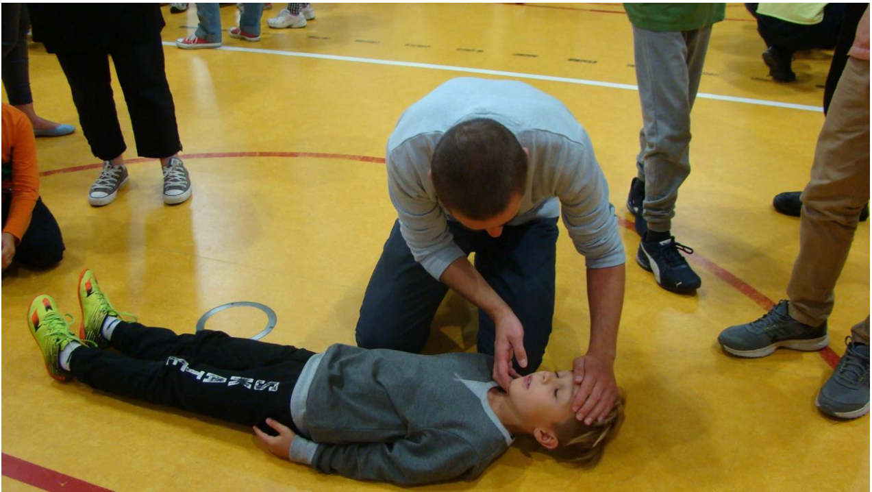
ćwiczenia w wykonaniu taty i syna