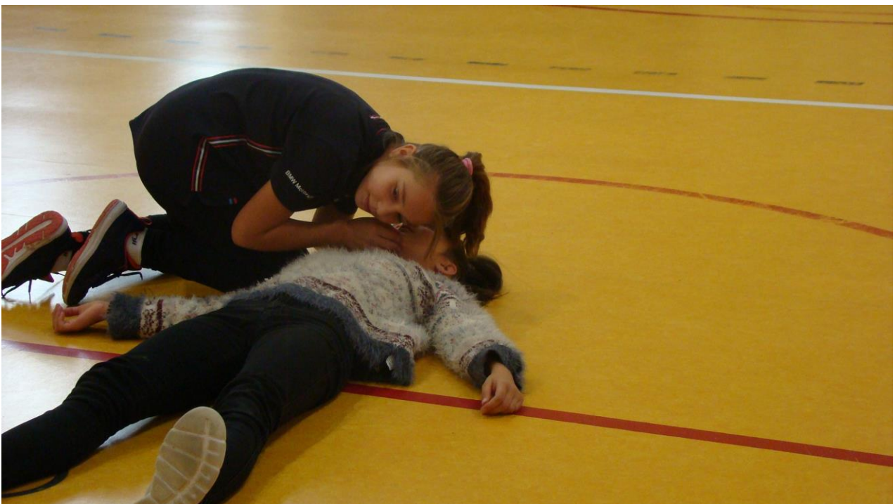
symulacja wypadku – sprawdzenie czy uszkodzona oddech