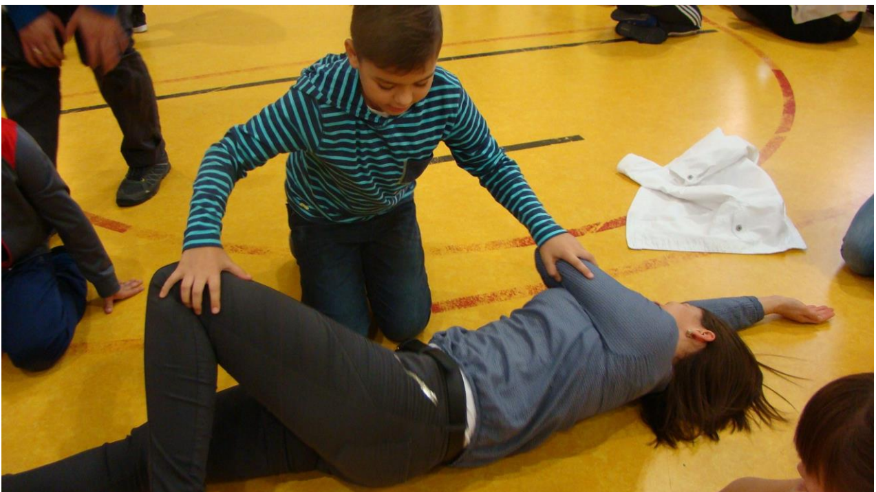
ćwiczenia mamy i syna – pozycja boczna bezpieczna